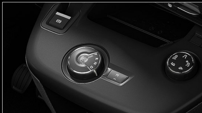
בורד הילוכים לתיבת 8 הילוכים אוטומטית