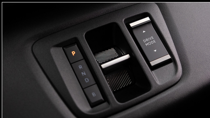
בורד הילוכים e-toggle לדגם חשמלי