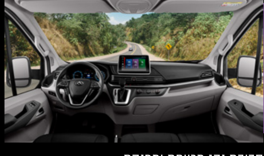
סביבת נהג מרווחת ומפנקת