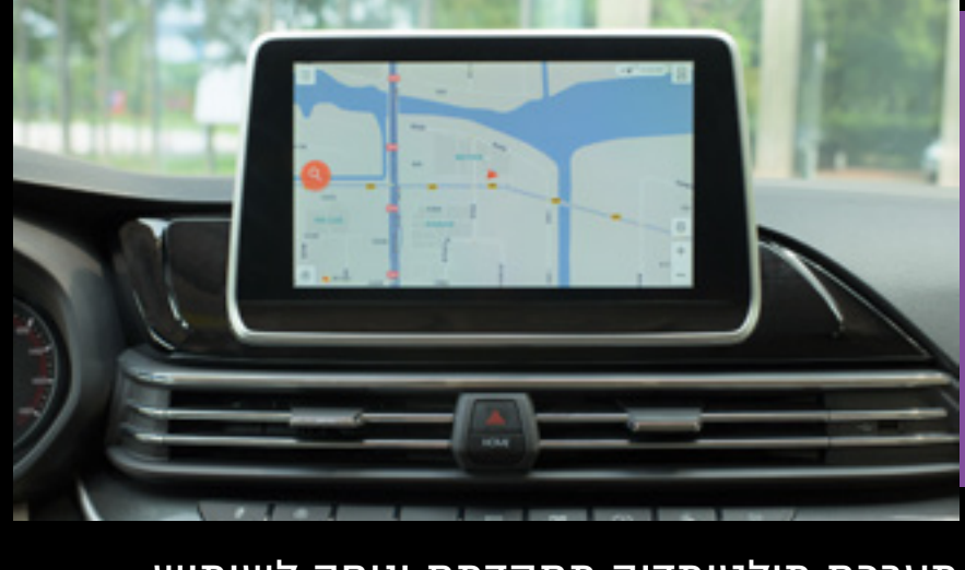
מערכת מולטימדיה מתקדמת ונוחה לשימוש