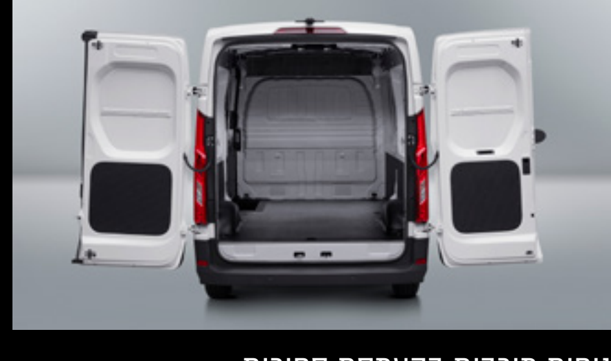
נחיות מיבית בהעמסת סחורות