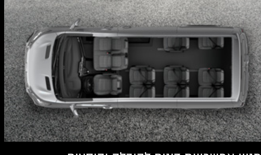
מסון אפשרויות דיגום להובלה והיסעים