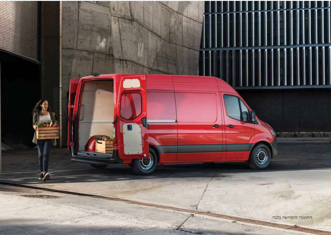
התמונה להמחשה בלבד.